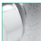
Najwyższej jakości stal ocynkowana 275 g/m 2

Trójnik prosty bez uszczelki - TB VENTO , wykonany z najwyższej jakości stali ocynkowanej (ocynk 275 g/m 2 ). Produkowane w procesie w pełni automatycznego zgrzewania liniowego.