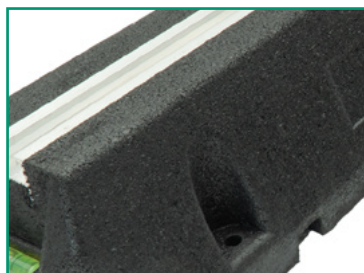
Gotowe otwory do montażu