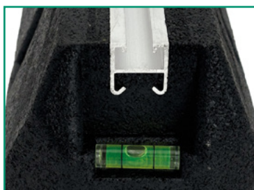
Szyna montażowa idealnie obsadzona w podstawie gumowej